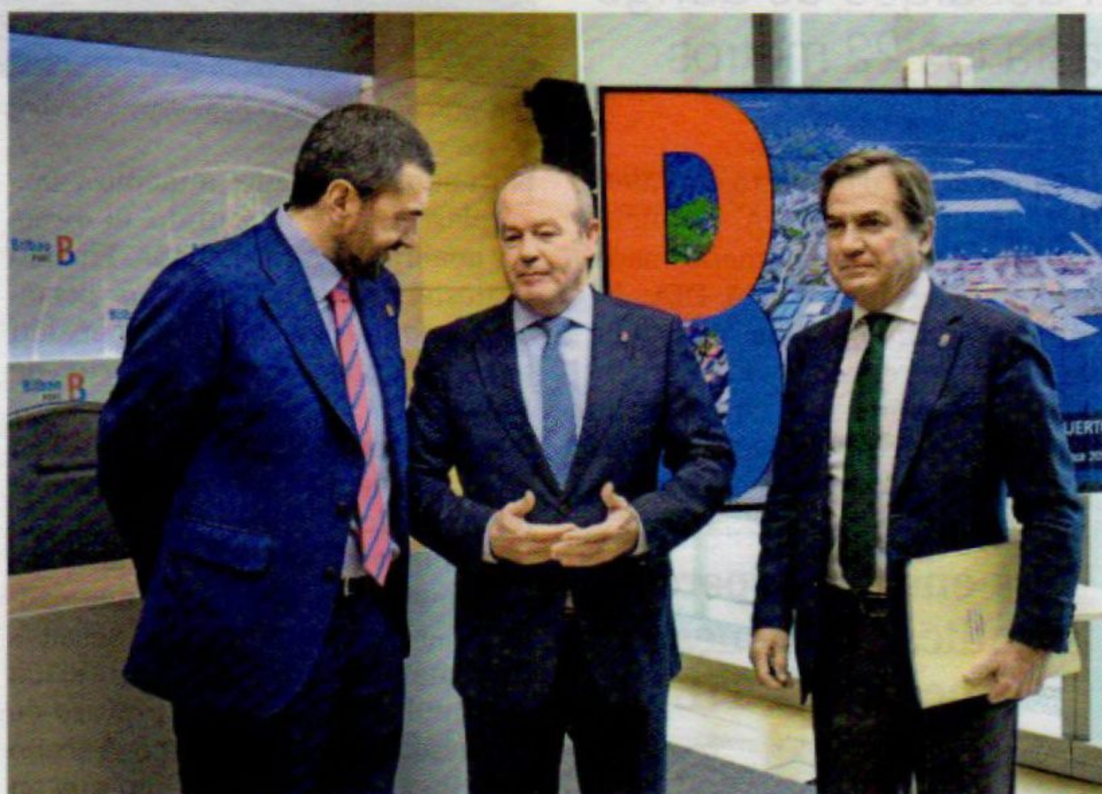
El presidente Ricardo Barkala, en el centro de la imagen, en un momento de la presentación.

có el máximo responsable del organismo portuario. En todo caso, recalcó que "fue una parada programada, con fuertes inversiones, que muestran el compromiso de la refinería por el puerto de Bilbao". Atendiendo a la forma de presentación de las mercancías, el crecimiento vino de la mano de los graneles líquidos, que suponen cerca del 60 por ciento del tráfico portuario. En concreto, este apartado registró un avance del 1,6 por ciento, hasta los 20,8 millones de toneladas, gracias, fundamentalmente, al ya mencionado incremento de la actividad de la planta regasificadora de Bahía de Bizkaia Gas (BBG),