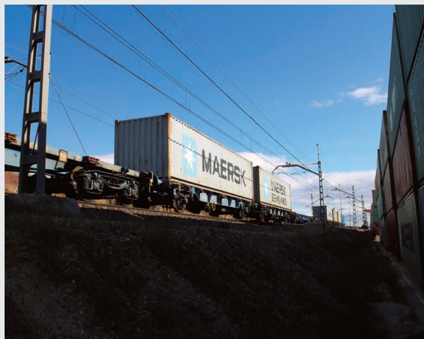
El tráfico nacional retrocedió un 17%.

El tráfico nacional en toneladas kilómetro descendió un 16,8%, mientras que el tráfico internacional retrocedió un 5,3%.