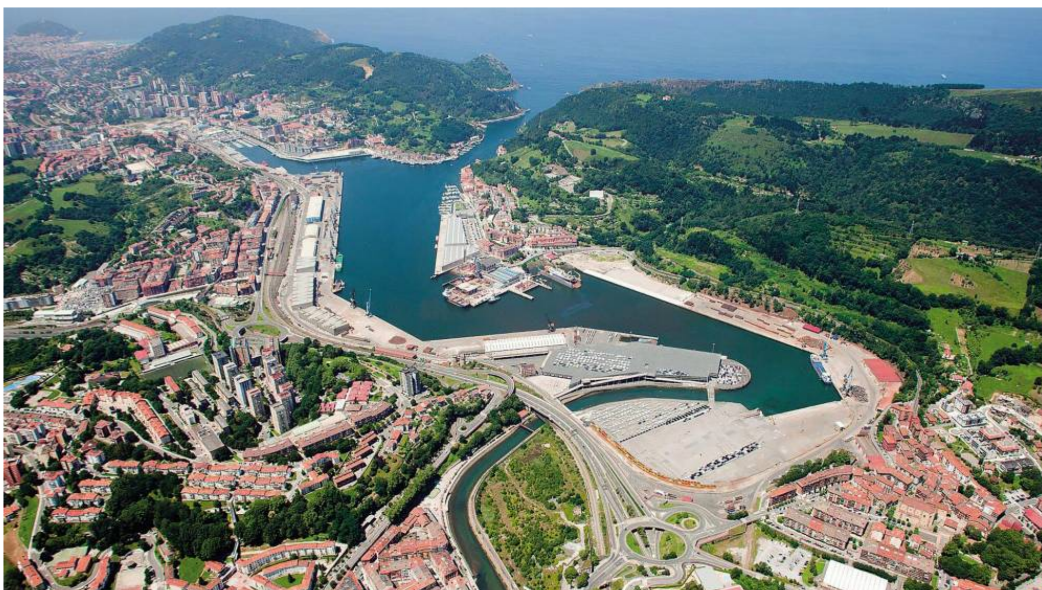
Prácticamente el 80% de la superficie de las terminales portuarias de Pasaia se encuentran en régimen de concesión.