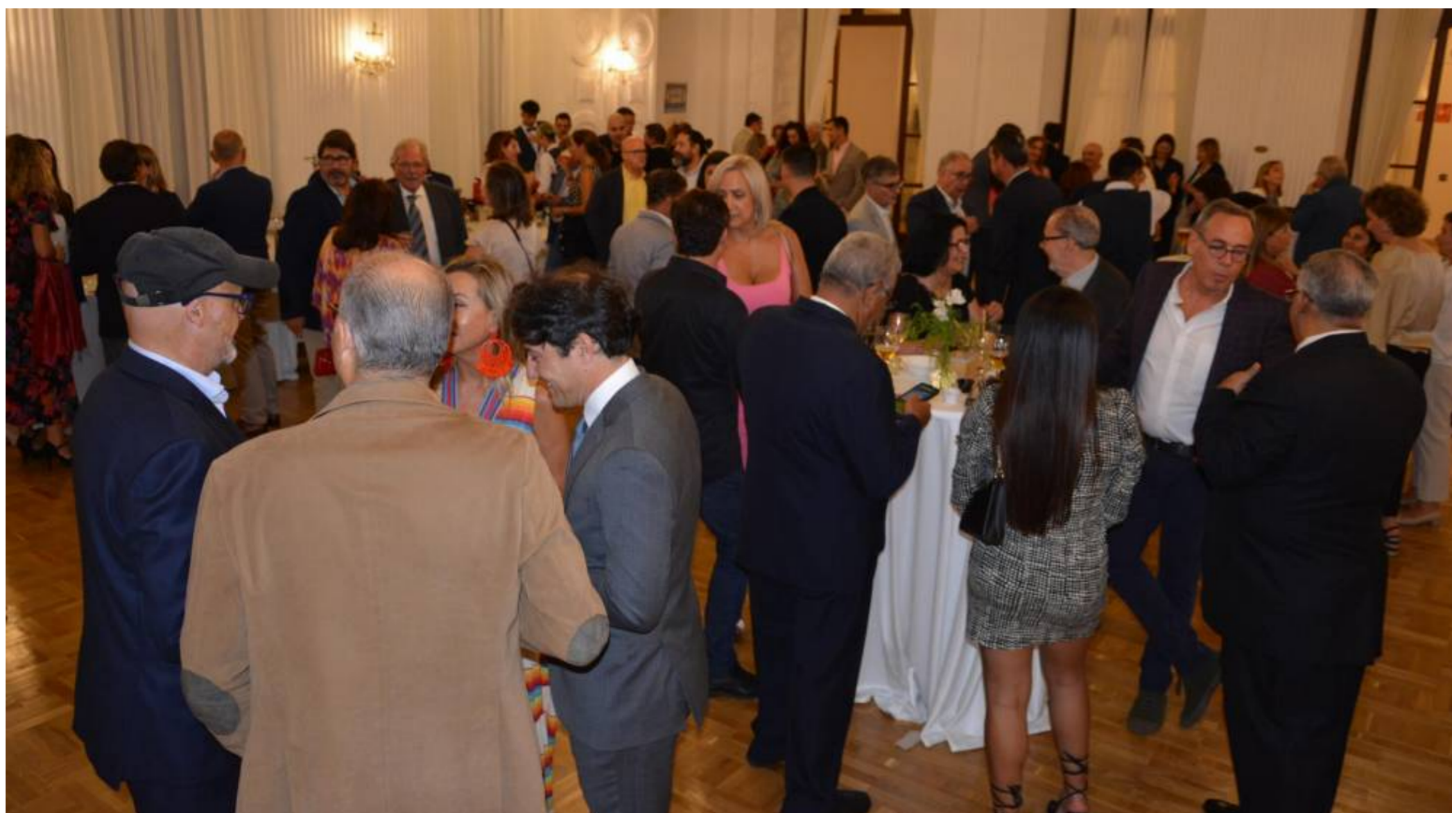
El programa incluye nueve ponencias sobre cuestiones de la máxima relevancia y actualidad