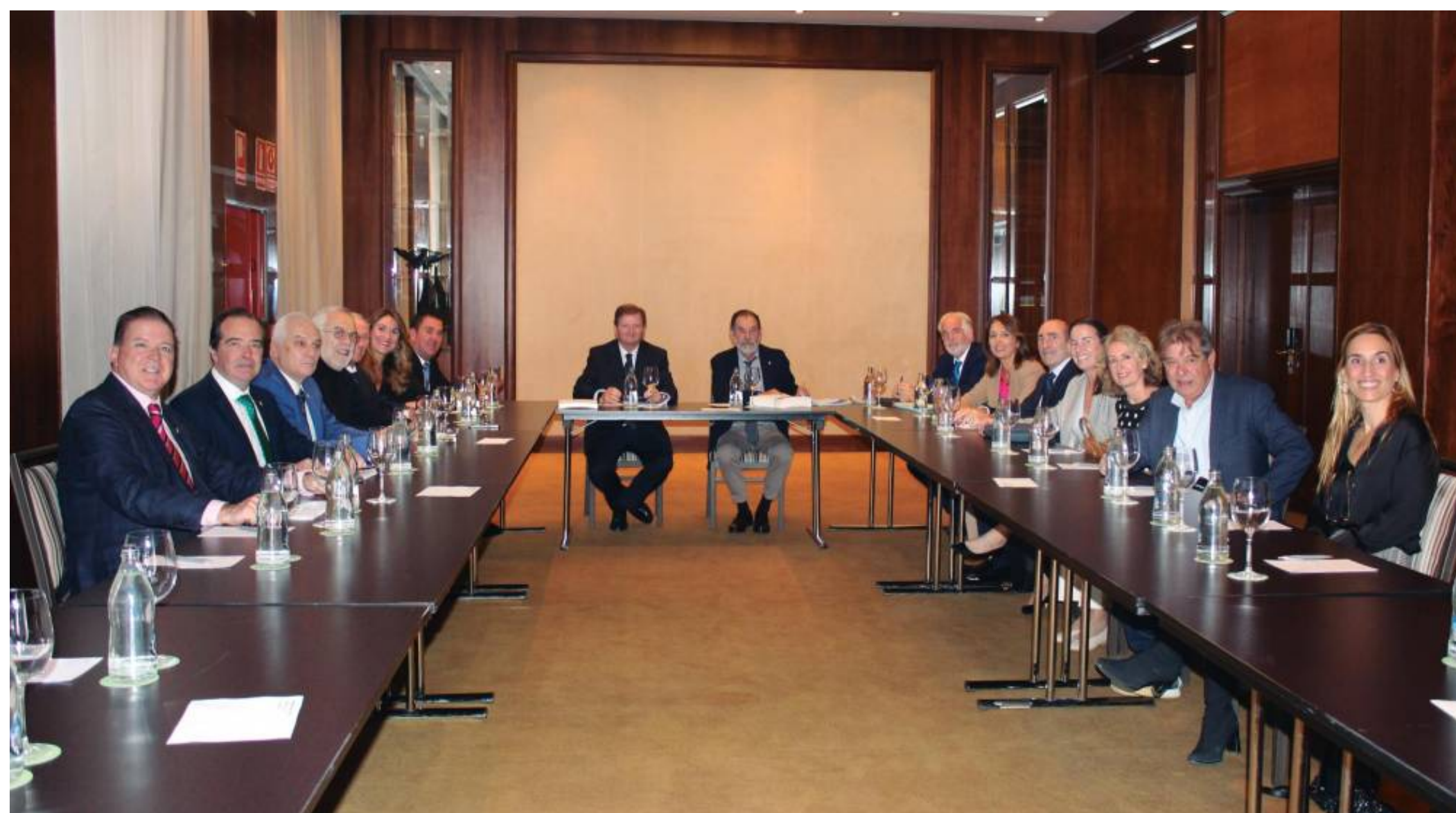
El pleno del Consejo General de Agentes de Aduanas ha abordado los principales puntos de la reforma del CAU.