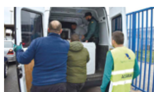
Los agentes de aduanas muestran su inquietud ante la reforma del CAU