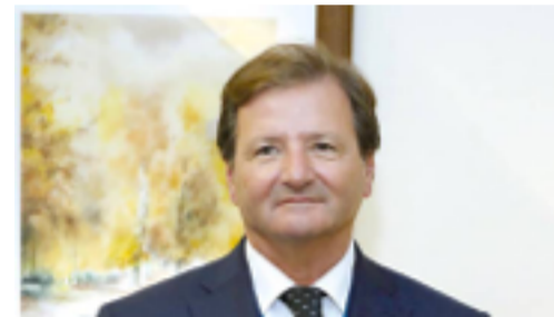
"El Trust & Check supondrá la desaparición del OEA y creemos que esta figura debe continuar"