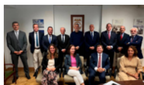
El CGAA muestra su preocupación por la reforma del CAU