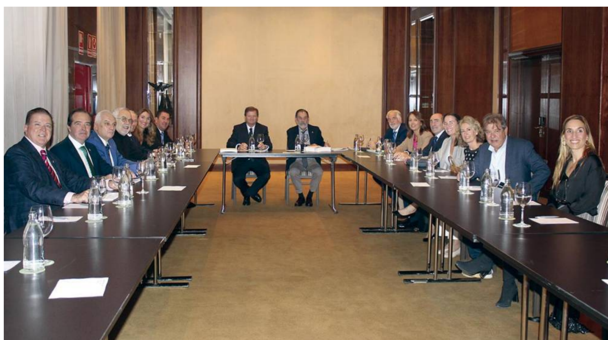
La reunión del pleno del Consejo General de Agentes de Aduanas da inicio al XIX Foro Aduanero que se celebra en Valencia.