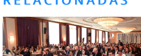
"Nunca nos hemos opuesto a los cambios, pero algunas propuestas del CAU deben ser corregidas"