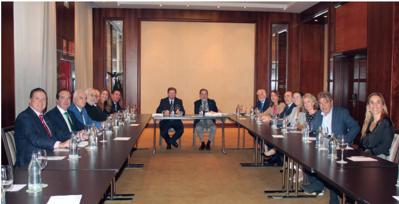
El pleno del Consejo General de Agentes de Aduanas ha abordado los principales puntos de la reforma del CAU.

LOGÍSTICA · El XIX Foro Aduanero se celebra desde hoy hasta el próximo sábado en la ciudad de Valencia