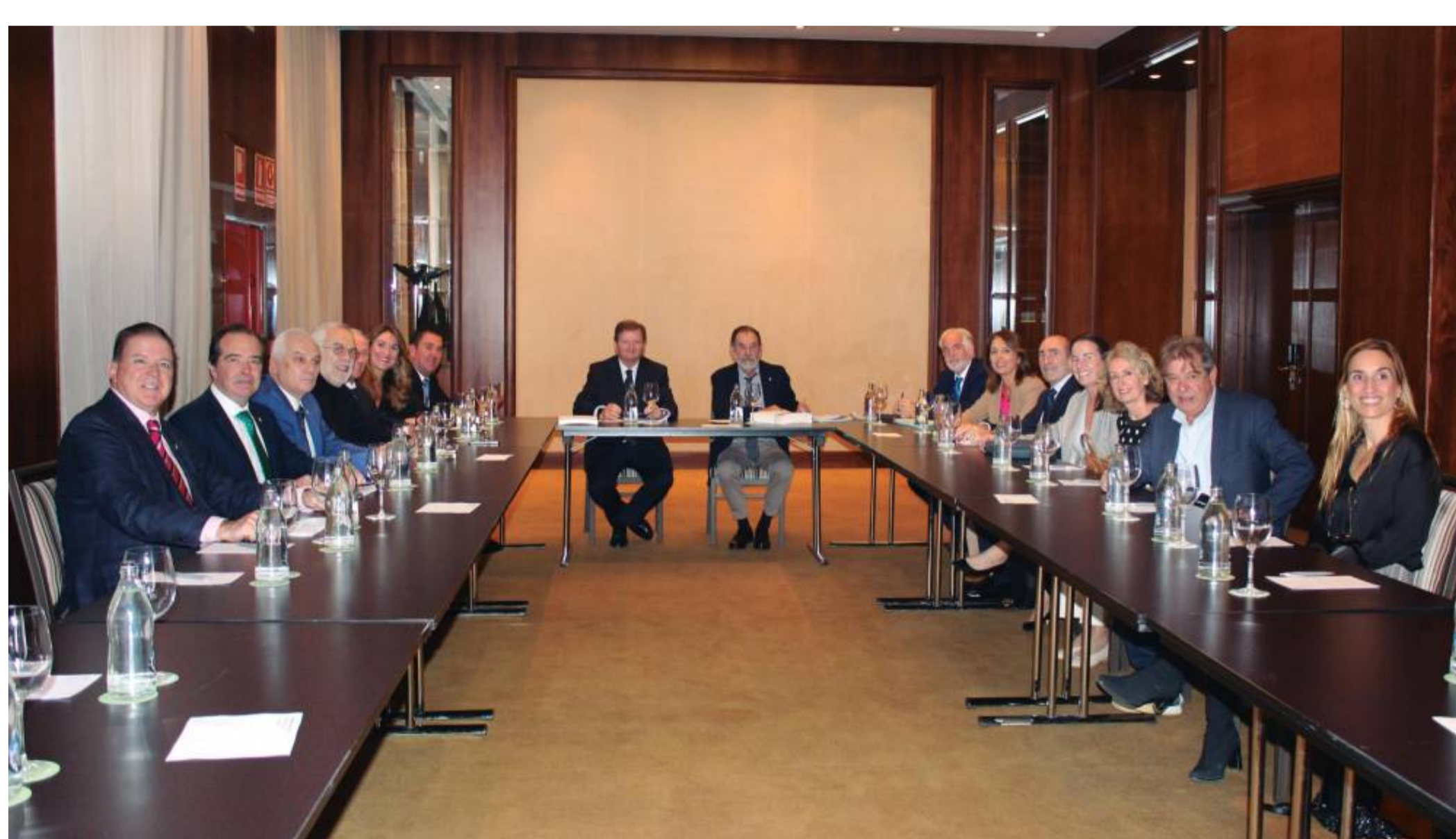
El pleno del Consejo General de Agentes de Aduanas ha abordado los principales puntos de la reforma del CAU.