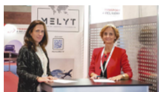
Logistics & Automation y MELYT firman un convenio para promover la igualdad