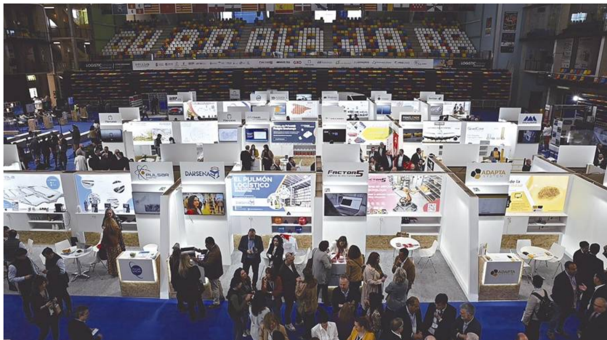
La IV feria Logistics Spain se celebrará los días 2 y 3 de abril de 2025.