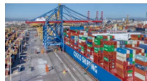
La Ocean Alliance afianza su apuesta por el mercado español en su nueva oferta de servicios

Los puertos españoles de Valencia, Barcelona y Algeciras, han sido incluidos en el Day9 Product de la Ocean Alliance, cuya firma ha sido rubricada por las navieras participantes en la misma: Cosco Shipping, CMA CGM, Evergreen y OOCL.