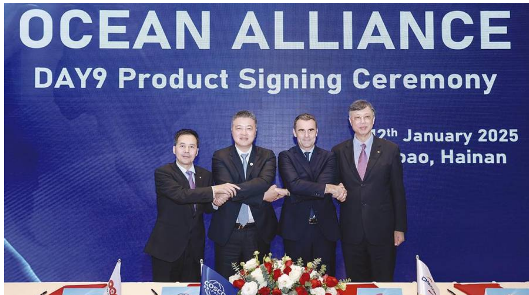
Las navieras de la Ocean Alliance han firmado la nueva versión de sus servicios marítimos.