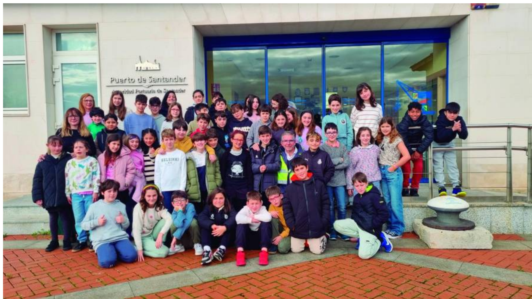
Cincuenta escolares del colegio Menéndez Pelayo han inaugurado el periodo de visitas 2025 del Puerto de Santander.