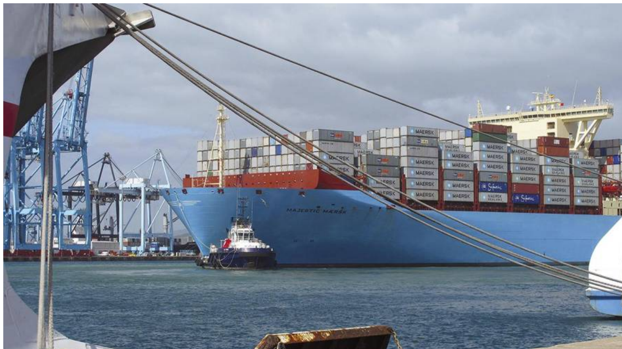
Maersk apunta que los cambios en los diferentes servicios y puertos de escala son habituales.